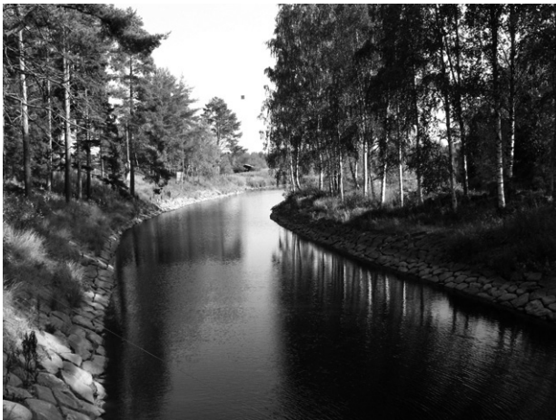
Saarikosken kanava Iisalmen Runnilla.

Ohjelman tarkemmasta sisällöstä ilmoitamme jäsenistölle ensi keväänä ilmestyvässä Lukasussa.