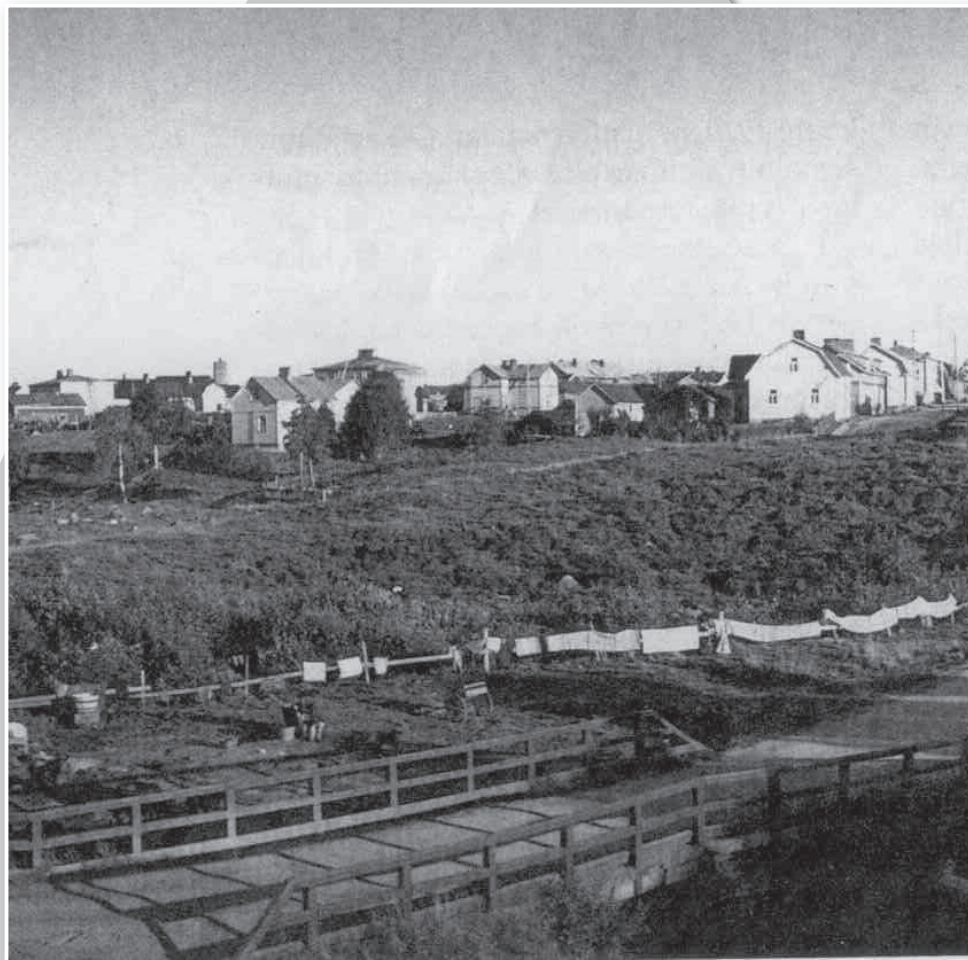
Pilketalon maisemaa vuonna 1938 Kajaanin Makkolan asuinalueella