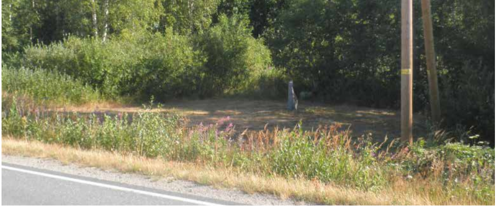
Muistokivi 24.7.2021 tieltäpäin.

tontilla. Lupiini häviää lopulta, kun se leikataan usean vuoden ajan ennen kukkimista. Samalla estyy puuntaimien ym. kasvaminen.