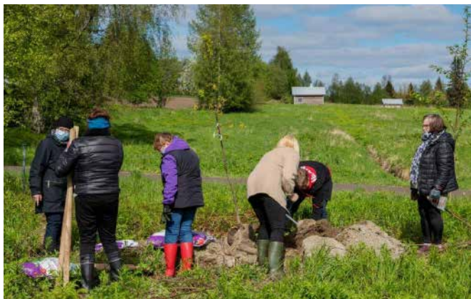
Tammimetsän istutusväkeä Paltamossa.