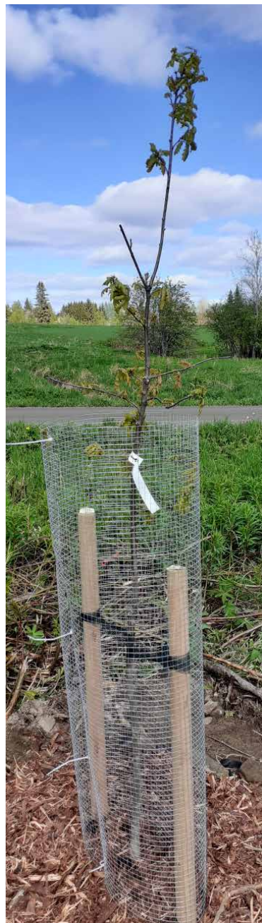
Sukuseuramme tammimetsän puu Paltamossa.