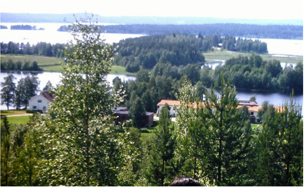
Kohtavaaralta opistolle päin otettu kuva. Vasemmalla on rehtorin asunto ja sitten opiskelija-asuntola ja opiston päärakennus. Siellä taustalla on Lipinsaari, jossa ne mökit ovat.

kansalaisopistosta, että siellä olisi opettajan paikka odottamassa. Parissa viikossa löytyi Lahdesta asunto ja lapsille päivähoitopaikkakin. Vaimo rupesi kulkemaan Lahdesta jaloin Helsingissä töissä ja niin meistä alkoi vähitellen tulla lahtelaisia.