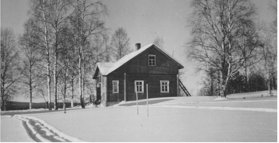
Tammaniemi talvella 1953

Järvelle päin antavalla seinällä oli pirtin toinen ikkuna ja sen lähellä ovesta katsoen vasemmalla oli pieni pöytä, jonka takana oli penkki ja sen edessä rahi. Pari tuolinreuhkaa oli milloin missäkin. Kun isä joskus retuutti pirttiin reen, oli tupa täysi. Isä haaveilikin niin isosta pirtistä, jossa mahtuisi reen pajuttamaan. Aikanaan hänellä sellainen olikin.